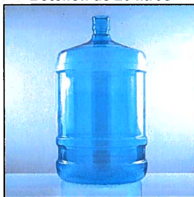
Imagen 1 Botellón de 20 litros